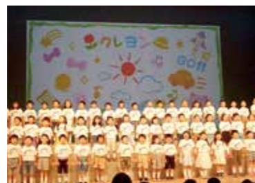
第31回本荘地区保育園子どもフェスティバル