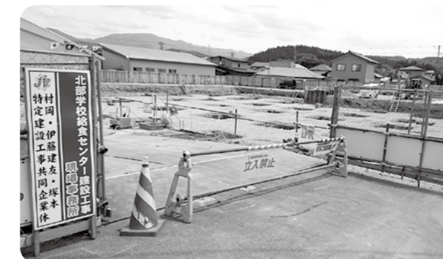
工事に着工した北部学校給食センター

答 公募型プロポーザル方式による業務委託契約を予定している。7月に募集要項配布、契約締結は11月下旬、契約期間は、令和2年8月から令和7年7月までの5カ年とする。