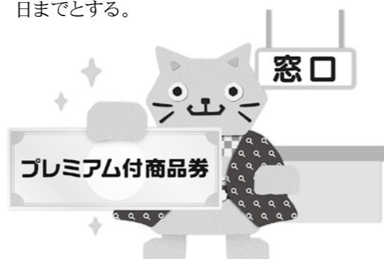
公式キャラクター「カクニヤン」

商品券の購入は令和元年10月1日から令和2年2月16日までとし、商品券の使用は2月29日までとする。