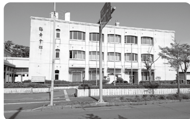
働く婦人の家がある鶴舞会館

答 第2講習室（和室）1時間の使用料は160円から170円に、談話室を引き続き使用する場合は月額2万1千円から3万9520円となる。また、談話室1時間の使用料は190円となる。