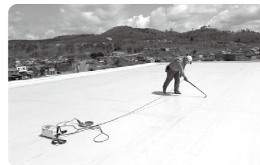
ナイスアリーナ屋根防水の点検状況

答 2月に発生したメインアリーナの雨漏りについて、発生箇所周辺を確認し修補を行った。また、4月に屋根全体を点検したが、その他損傷箇所は発見されなかった。 なお、建設工事に対する補償期間は、屋根防水は10年間であるが、その他については2年間となっている。