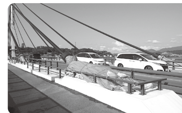
2カ所目の保護鋼管修繕箇所

答 平成30年3月の上流側C1ケーブル工事と同様に、より強度の高いボルトで固定する対策工事を実施する。また全ケーブルの点検と保護鋼管取付ボルトの増し締めを実施するほか、日常点検で確認しやすいマーキングを施す。