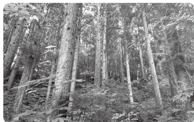
間伐などの整備を待つ人工林

答 本市に譲与される森林環境譲与税を適正に管理運用することと、林業経営の効率化、森林整備の促進などのために森林環境整備基金を設置するものである。