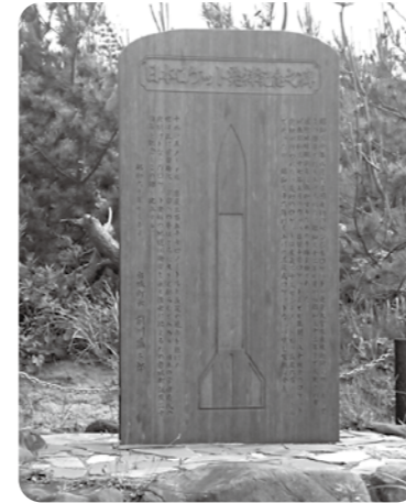
旧岩城町にある日本ロケット発祥記念の碑

答 東大生産技術研究所が創立70周年を記念し、ロケット研究開発に縁がある本市を含む全国の自治体6市区町と東大生産技術研が連携協定するものである。 具体的には、産業振興、まちづくり、教育などで、取り組みを協働して推進することになる。