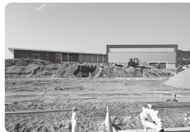
外構工事が進む総合防災公園

また、幼児エリア、木育エリアへの遊具の設置については一部既製品になるが、木育遊具については、市内の木工業者に依頼して設置する。