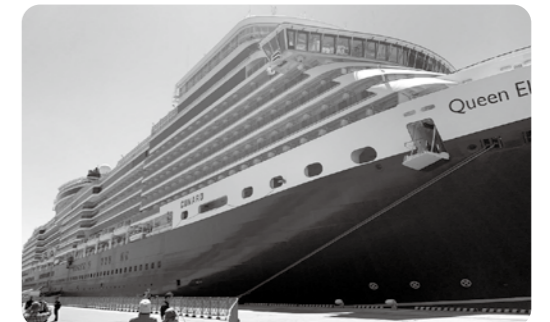
秋田港へ寄港した大型クルーズ船

答 秋田県内各地の魅力発信で地域経済への波及効果が期待される。本市でも誘客できないか調査検討する。