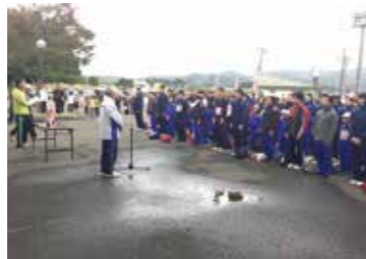
駅伝大会の開会式