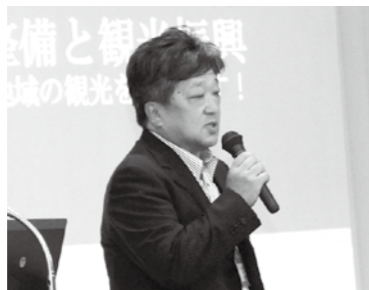
鈴木氏による講演

の整備と観光振興」と題して講演、本市市議会議員からも聴講しました。講演では、最近の観光の特徴や地域の観光の分析、誘客のためPRの重要性について解説しました。また、観光振興を高速交通の整備だけに頼らず、地域を見直して観光資源を発掘することも必要と力説され、具体的に本市の芋川桜づつみを観光資源として開発、活用することを提言しました。参加者らは、メモをとるなどして熱心に聴講していました。