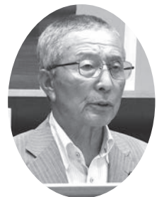
佐々木 隆一 (日本共産党)