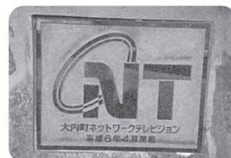
ケーブルテレビ指定管理へ

答 株式会社秋田ケーブルテレビが指定管理者となる。指定の期間は令和5年4月1日から令和10年3月31日までの5年間である。また、指定管理料の提案額は年額7000万円である。