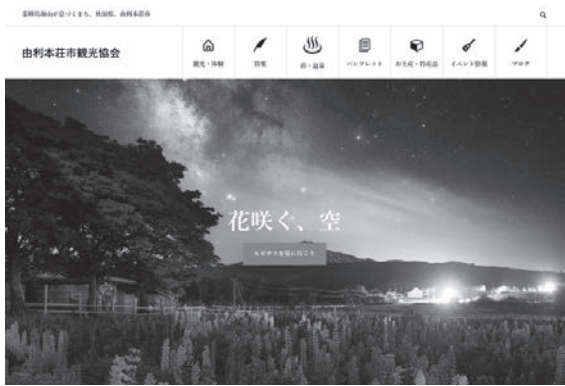
観光協会ホームページ

県立大学本荘キャンパスでは、AIを活用して閲覧データを分析し、閲覧者に対し有効な情報提供ができるシステムについて研究していると聞いている。今後はそのような先端技術を情報発信に活用することも視野に入れる。