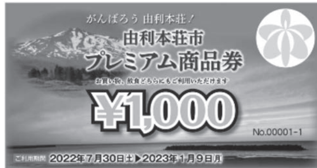
プレミアム商品券(見本)

1人2セットまで購入可能であるが発行数を超える申し込みがあった場合は抽選を実施する。当選者へは、引換券を送付する。