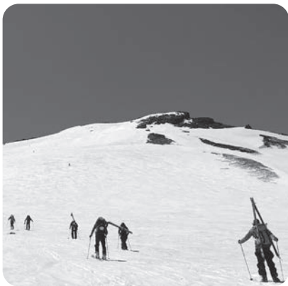
春の鳥海山登山者

答 山におけるトイレの存在は非常に大切なセールのポイントであり、速やかな設置と快適に使えるよう努める。さまざまな連携不足を十分に検証し、関係部署、環鳥海エリア関係機関と連携を図り、誘客につながる情報発信、PRの研究を深めていく。