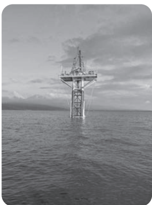
海底調査のためのやぐら

答 再エネ賦課金の上昇が市民生活の負担となっている実情は認識しているものの、全国一律の単価で、広く国民が負担することでの成り立っている。市民に直接助成は考えていない。