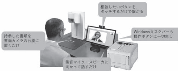
リモート相談窓口のイメージ

キーボードもマウスも無く、最初に画面タッチするだけで簡単につながります。PCではなく「相談専用端末」。ご高齢の方でも簡単に利用できます。