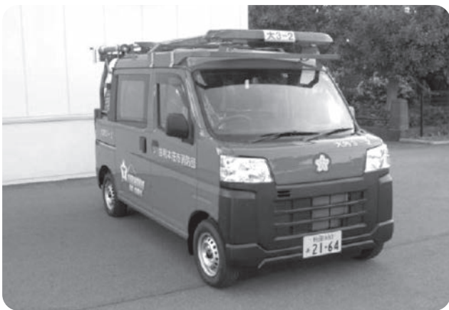
導入される軽積載車

軽積載車はオートマチック(AT)仕様で、普通免許・AT限定免許でも運転可能となる。今後も、普通免許証で運転可能な車両導入を考えている。