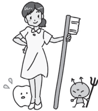
歯と口腔の健康を守る歯科衛生士

答 現在、歯科衛生士は健診などの事業時のみの雇用である。口腔の健康相談は保健師が随時対応している。 来年度、「健康由利本荘二十一年計画」の評価に際し、歯科衛生士の業務内容や量について検討していく。