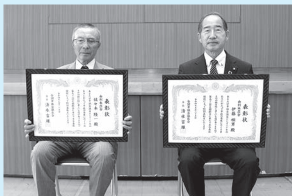
左から 佐々木隆一議員、伊藤順男議員