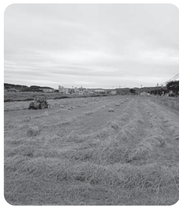
大幅な減額となる多年生牧草

問 本市の農業および畜産農家へ与える影響と支援策の考えは。 答 畜産農家などへの影響は、交付金単価が激減することにより、約7300万円の減額が見込まれる。産地交付金の各種加算対象となる取り組みに誘導を図っていく。 そば、大豆などにも、広く影響が懸念されるので、生産現場の実態や課題に即した運用に改善されるように、関係省庁に働きかけていく。