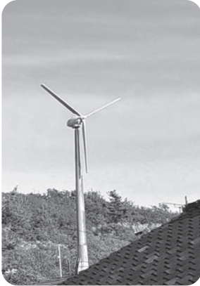
住居に近い小形風力発電施設

答 条例化すると土地所有者、事業者の権利を不当に制限することにつながり、訴訟リスクが懸念されるため考えていない。